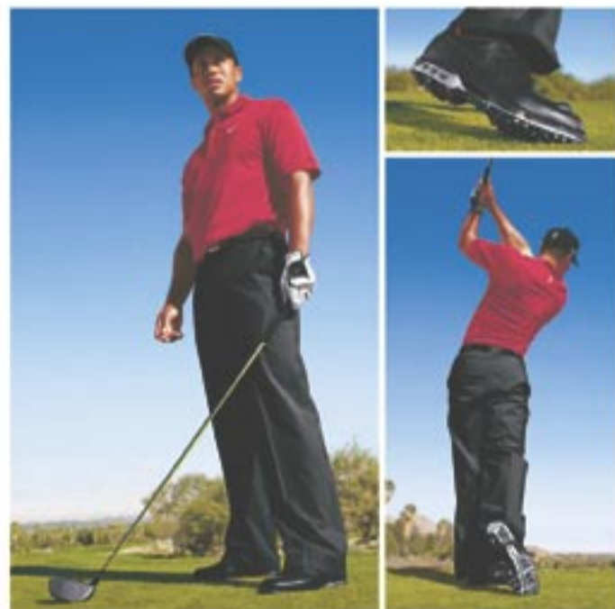
Abb. 1) Jetzt bleibt die Innenseite meines Fußes beim Durchschwingen länger am Boden. Und genau durch diesen längeren Bodenkontakt kann ich mich kräftiger abstoßen und meinem Schwung zu mehr Power verhelfen. Jetzt sind Sie dran. Sagen Sie dem Ball Lebwohl.

Auf dem Golfplatz geht es buchstäblich auf und ab, und das sollte auch bei einem Golfschuh möglich sein. Durch die Forefoot Flex Channels haben Ihre Füße genügend Bewegungsfreiheit, um sich auch auf unebenem Gelände anzupassen.