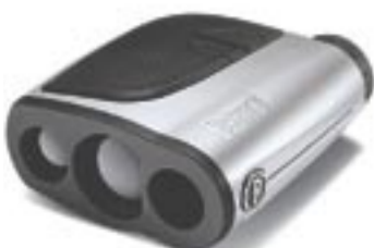
Zum Turnier zugelassen: Yardage Pro.

95 Prozent der PGA-Tour-Pros nutzen bereits die Bushnell Golf Laser-Entfernungsmesser zum Training. Das neue Modell „Yardage Pro Medalist“ misst auf Knopfdruck auch die Entfernung zu kleinen und schmalen Zielen, wie etwa der Pinflag. www.dulbisGolf.de