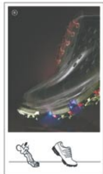
Forefoot Flex Channels: Bestimmte Bereiche in Ihren Füßen bewegen sich. Bestimmte Bereiche in Ihren Schuhen bewegen sich. Biegen Sie Ihren Fuß auf jedem Untergrund, ganz gleich wo Sie stehen.